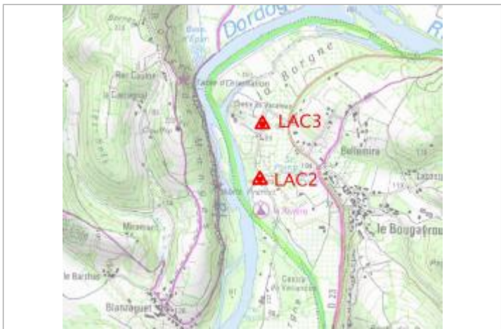
Localisation carte IGN

GÉNÉRAL Code : LAC3 Date de mise à jour : 10/02/2022 Auteur : gremminger