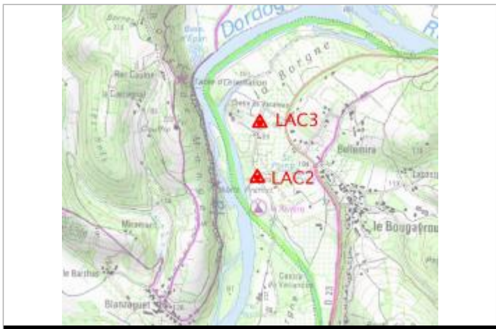
Localisation carte IGN

GÉNÉRAL --- Code : LAC3 Date de mise à jour : 10/02/2022 Auteur : gremminger