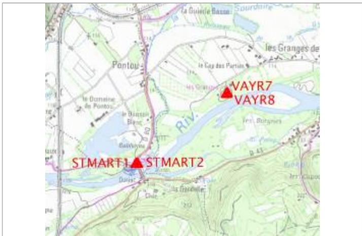
Localisation carte IGN

GÉNÉRAL Code : ST MART2 Date de mise à jour : 10/02/2022 Auteur : gremminger