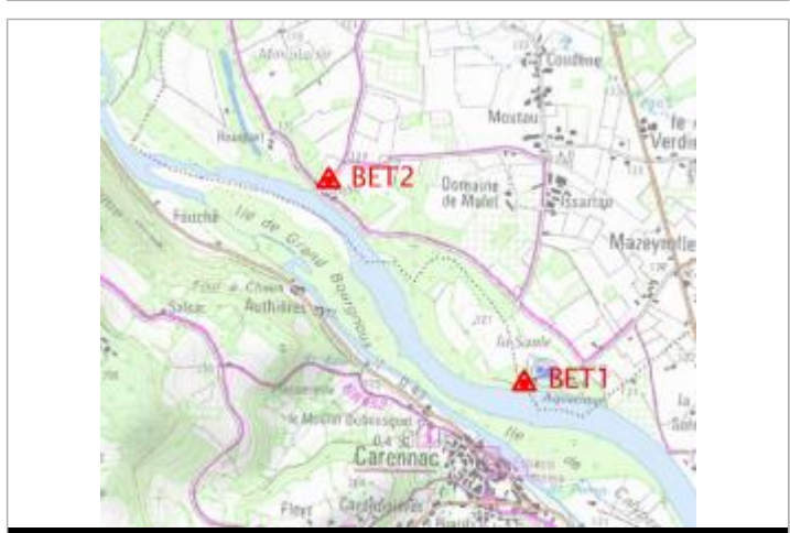
Localisation carte IGN

GÉNÉRAL Code : BET2 Date de mise à jour : 10/02/2022 Auteur : gremminger