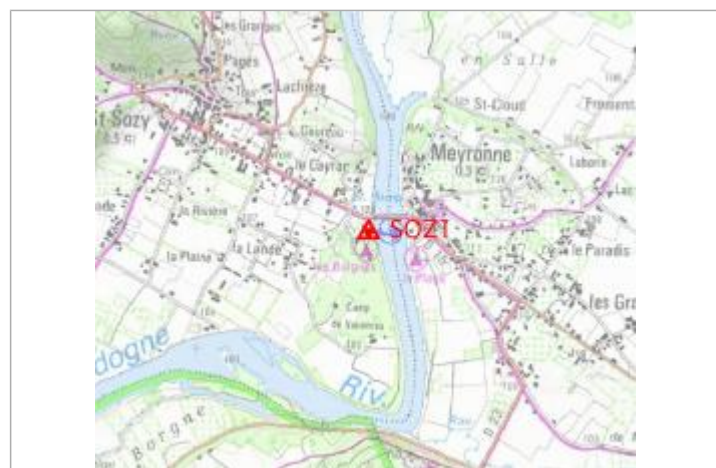
Localisation carte IGN