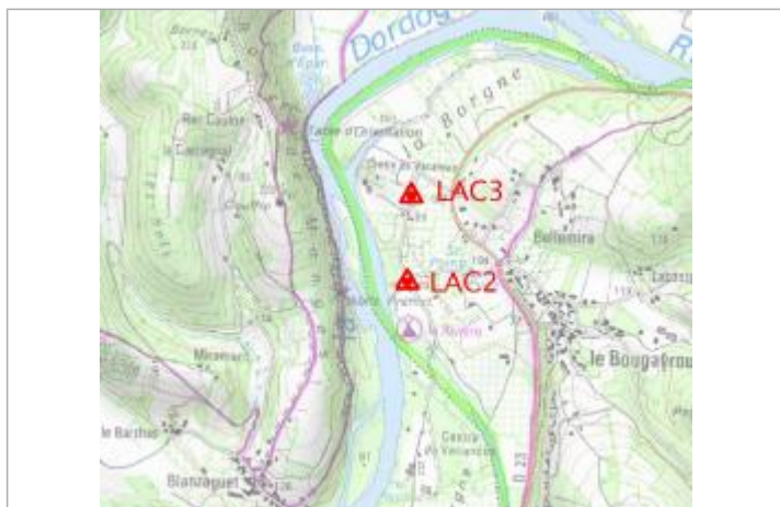
Localisation carte IGN