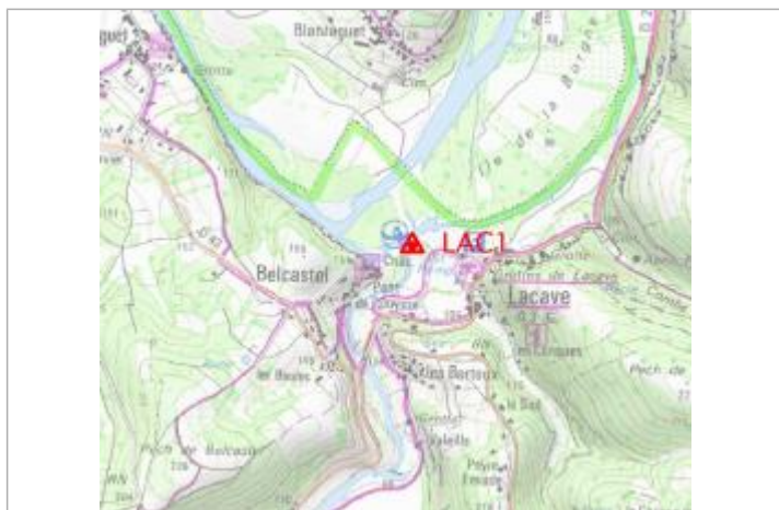
Localisation carte IGN