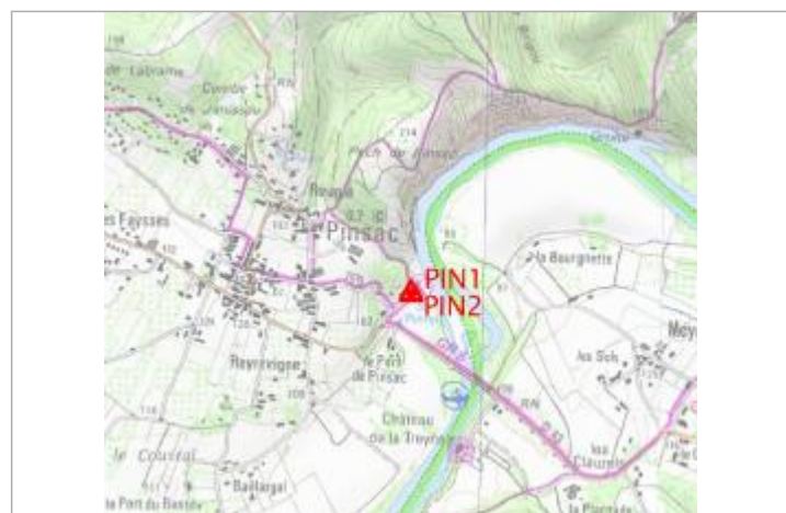
Localisation carte IGN