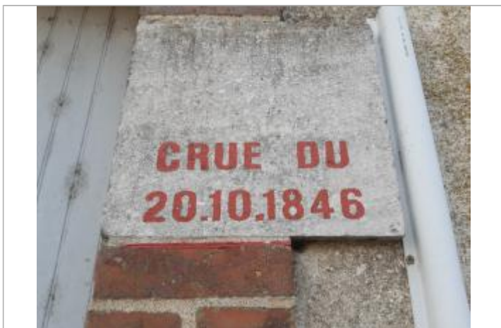
Photo rapprochée du repère, en 2021

Texte : CRUE DU 20.10.1846 Maximum de l'inondation : Oui Visibilité : Oui État du repère : Bon Pérennité : Longue