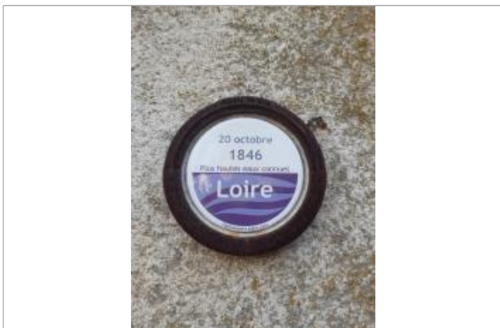
Photo rapprochée du repère, en 2021

Texte : 20 octobre 1846 - Plus hautes eaux connues - Loire Maximum de l'inondation : Oui Visibilité : Oui État du repère : Bon Pérennité : Longue