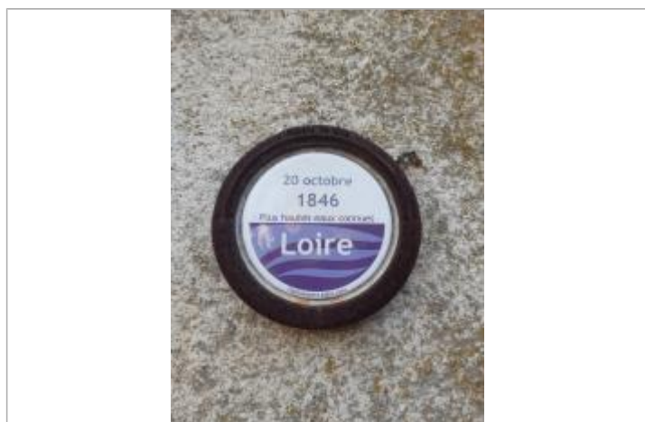
Photo rapprochée du repère, en 2021

Texte : 20 octobre 1846 - Plus hautes eaux connues - Loire Maximum de l'inondation : Oui Visibilité : Oui État du repère : Bon Pérennité : Longue