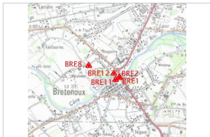
Localisation carte IGN