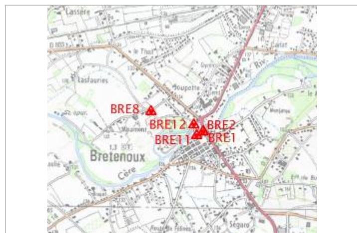
Localisation carte IGN