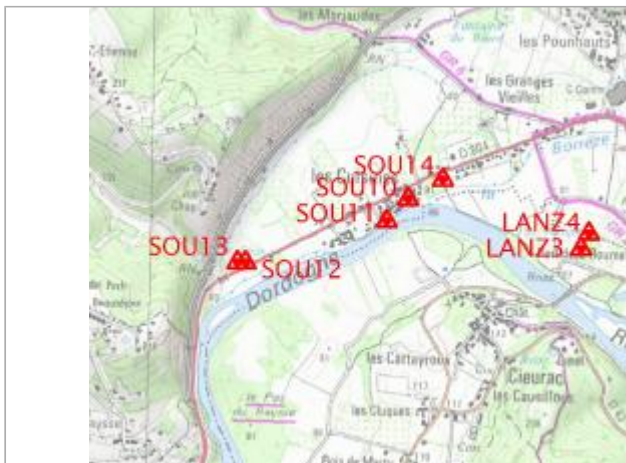
Localisation sur carte IGN