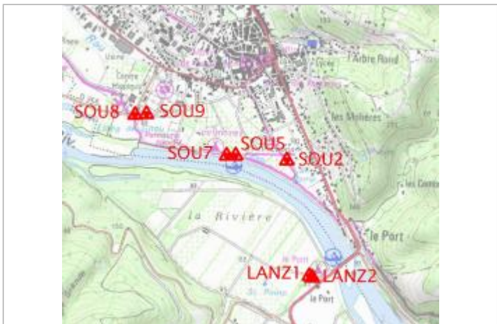
Localisation carte IGN