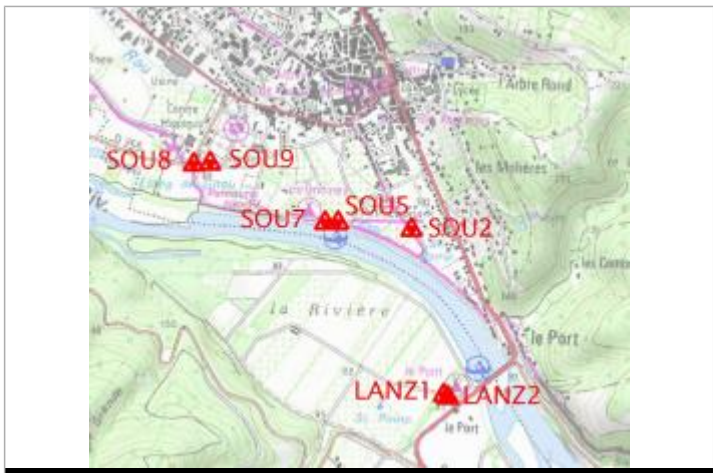
Localisation carte IGN