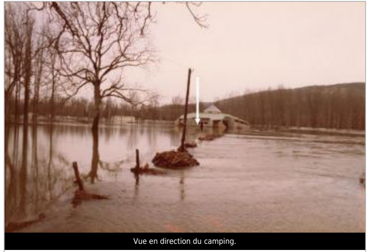
Vue en direction du camping.