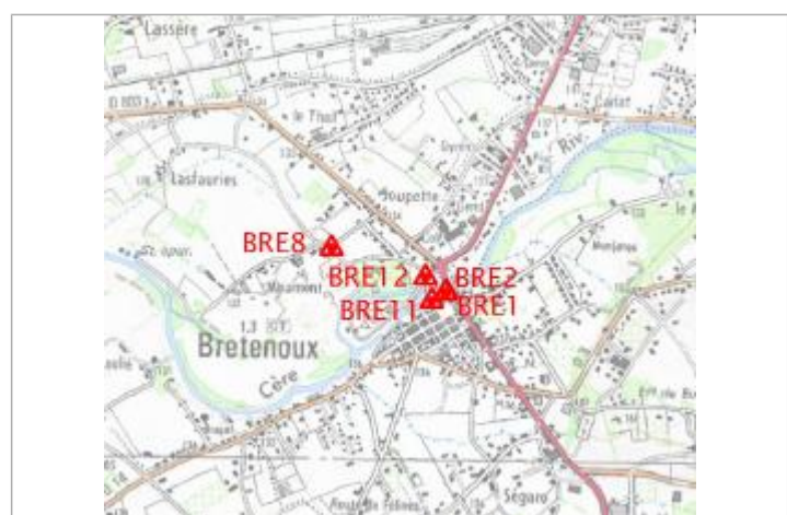
Localisation carte IGN

GÉNÉRAL Code : BRE8 Date de mise à jour : 10/02/2022 Auteur : gremminger