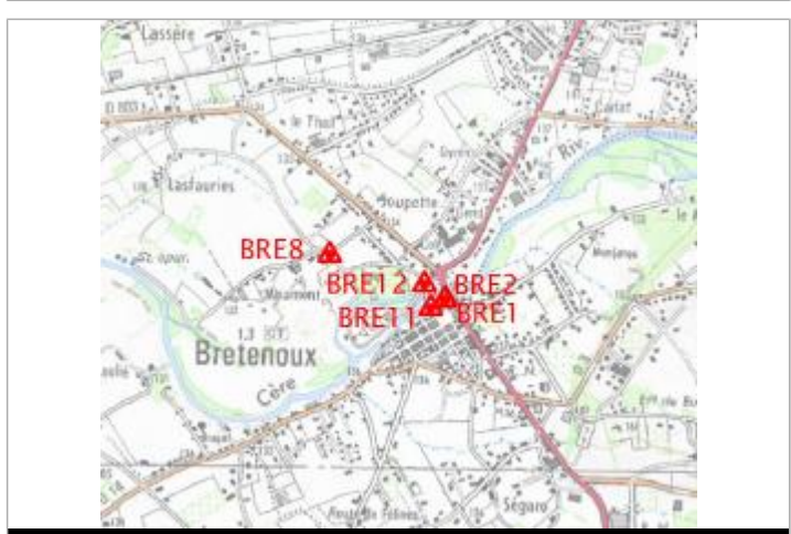
Localisation carte IGN

GÉNÉRAL Code : BRE8 Date de mise à jour : 10/02/2022 Auteur : gremminger