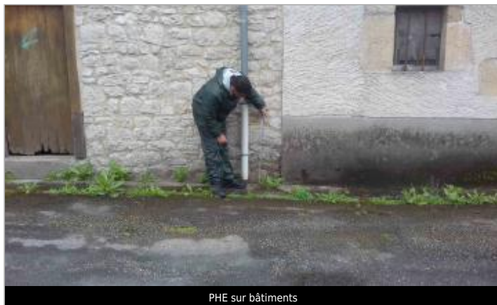
PHE sur bâtiments