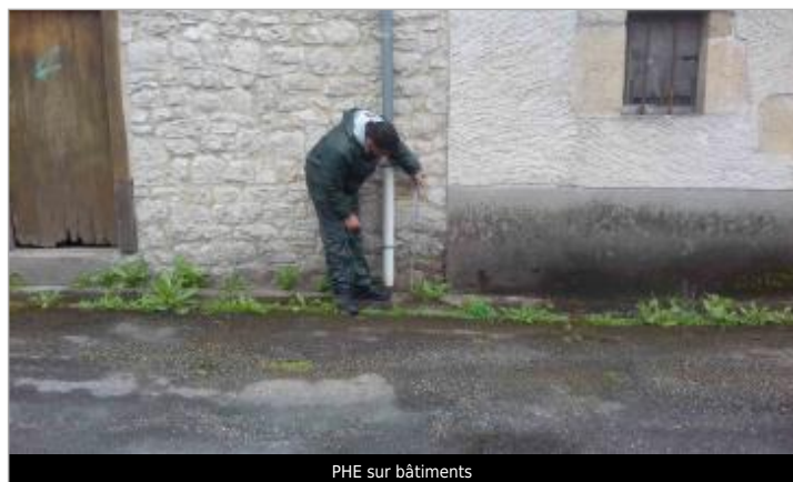
PHE sur bâtiments