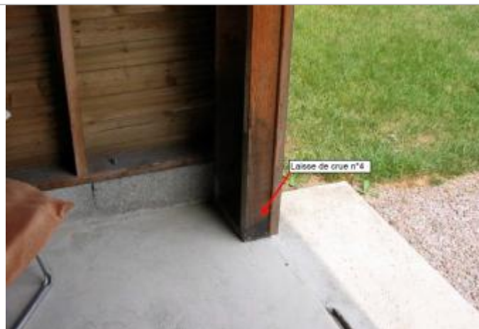
Photo du repère en 2004

Différence entre le niveau d'eau et la référence (en m) : 0.100 m