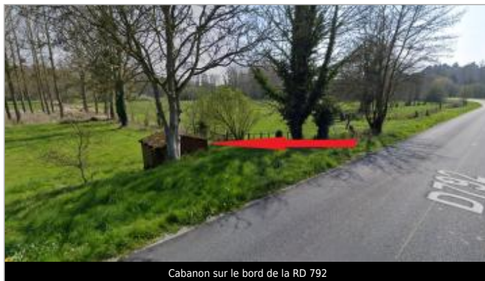
Cabanon sur le bord de la RD 792