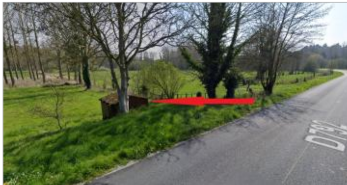
Cabanon sur le bord de la RD 792

Coordonnées WGS84 : X: -2.24987580 / Y: 48.51276700