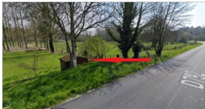
Cabanon sur le bord de la RD 792