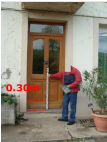
1 moulin de Maxevoy 88130 BATTEXEY - Laisse de crue du 03/10/2006. 252,01m/NGFIGN69