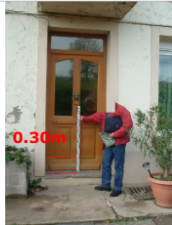
1 moulin de Maxevoy 88130 BATTEXEY - Laisse de crue du 03/10/2006. 252,01m/NGFIGN69

Coordonnées RGF93 (ETRS89) : X: 6.1693708 / Y: 48.3889787