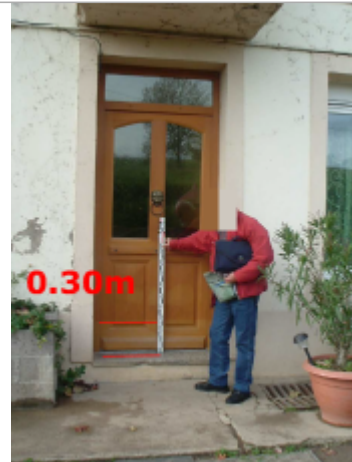
1 moulin de Maxevoy 88130 BATTEXEY - Laisse de crue du 03/10/2006. 252,01m/NGFIGN69

Coordonnées RGF93 (ETRS89) : X: 6.1693708 / Y: 48.3889787