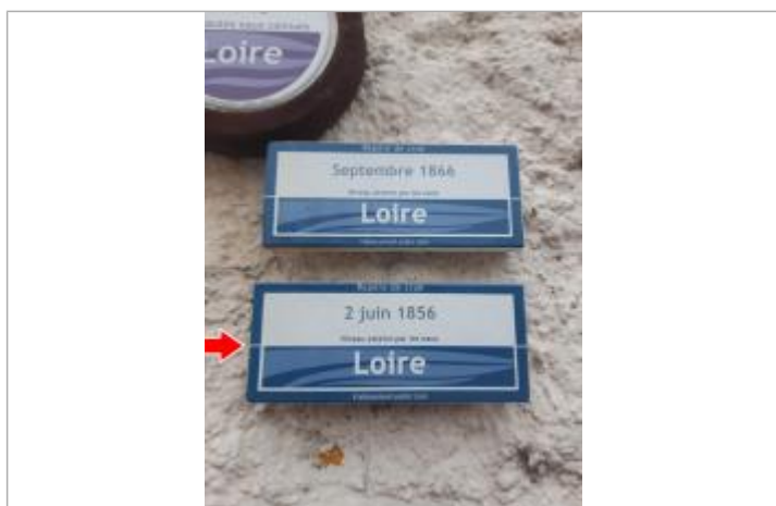
Vue rapprochée du repère, en 2021