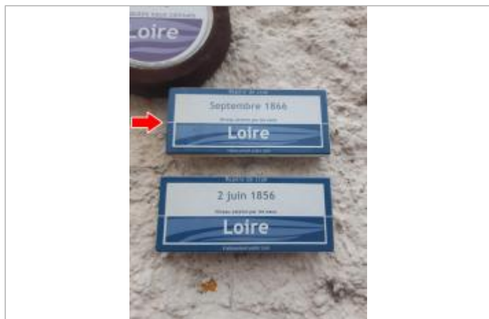
Vue rapprochée du repère, en 2021