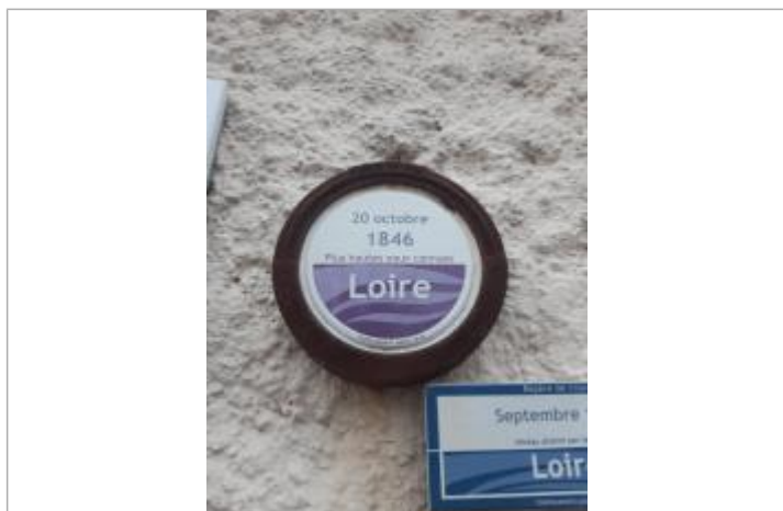
Vue rapprochée du repère, en 2021