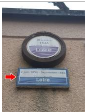
Vue rapprochée du repère, en 2021