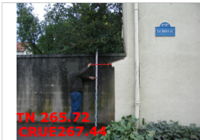
13 quai le Breuil 88500 MIRECOURT - Laisse de crue du 03/10/2006. 267,44m/NGFIGN69