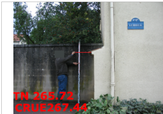
13 quai le Breuil 88500 MIRECOURT - Laisse de crue du 03/10/2006. 267,44m/NGFIGN69

Coordonnées WGS84 : X: 6.13705303 / Y: 48.30214970