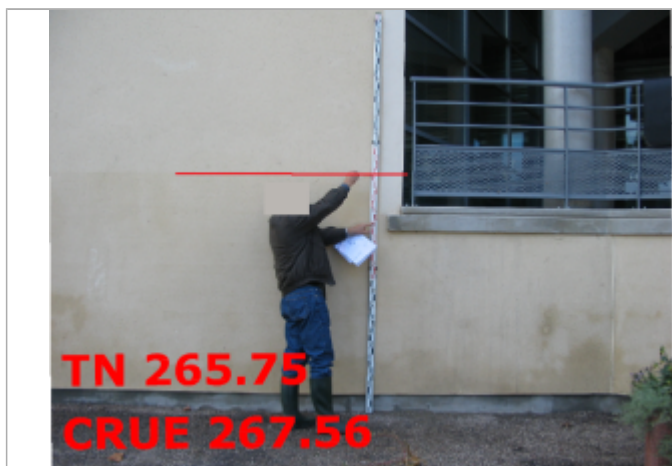
Cours Stanislas 88500 MIRECOURT - Laisse de crue du 03/10/2006. 267,56m/NGFIGN69