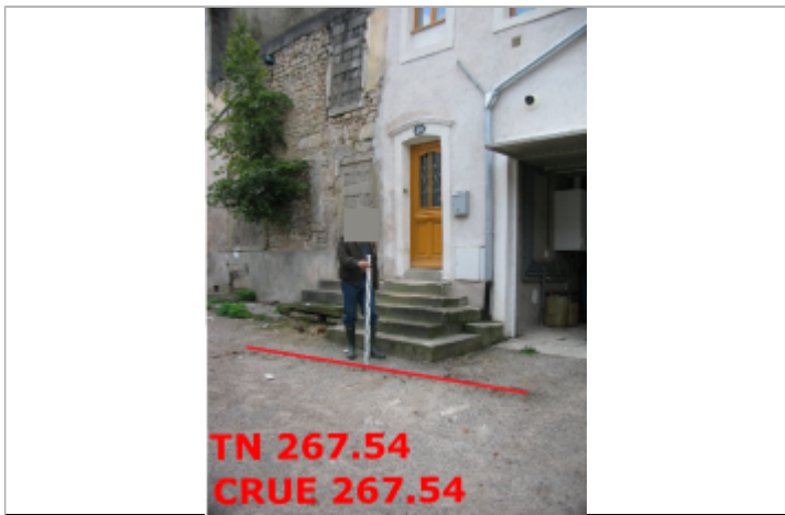
48 rue Vuillaume 88500 MIRECOURT - Laisse de crue du 03/10/2006. 267,54m/NGFIGN69

MARQUE Maximum de l'inondation : Non renseigné Visibilité : Non renseigné