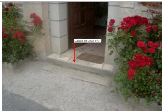
Relevé de la laisse de crue par BCEOM en 2003