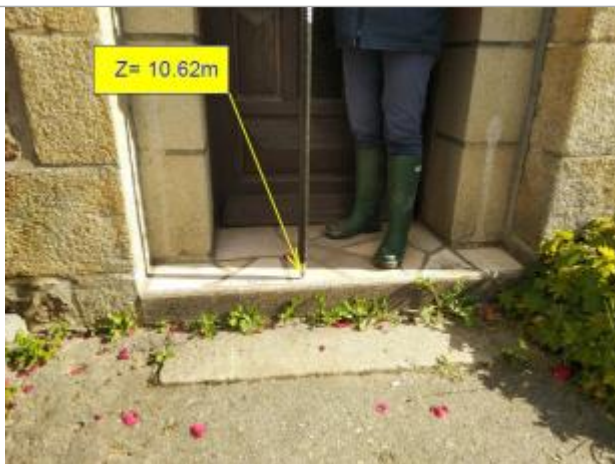
Nivellement en octobre 2021 par la DDTM 22

Altitude calculée de l'eau (en m) : 10.62 m