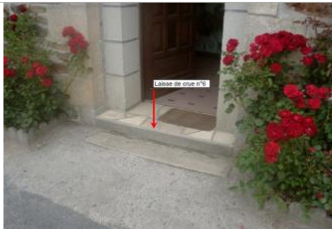
Relevé de la laisse de crue par BCEOM en 2003