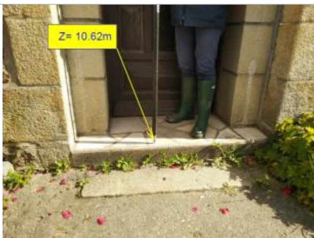
Nivellement en octobre 2021 par la DDTM 22

Altitude calculée de l'eau (en m) : 10.62