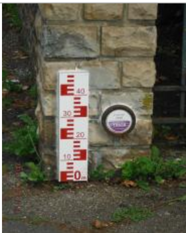
Vue du repère en 2014