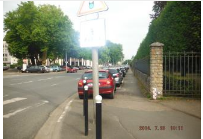
Vue du site en 2014

Coordonnées WGS84 : X: 2.39722200 / Y: 47.08833300