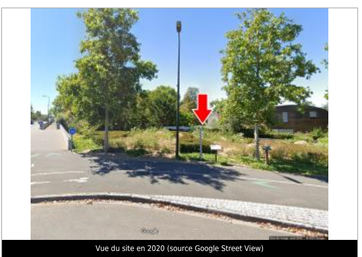
Vue du site en 2020

GÉOLOCALISATION Coordonnées WGS84 : X: 1.90352500 / Y: 47.87049500 Coordonnées RGF93 (Lambert 93) X: 618028.16 / Y: 6752802.53 Coordonnées RGF93 (ETRS89) : X: 1.903525 / Y: 47.870495