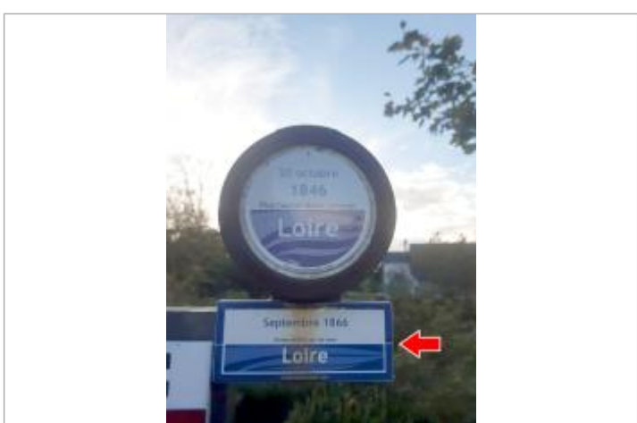
Vue rapprochée du repère, en 2021

MARQUE Texte : Septembre 1866 - Niveau atteint par les eaux - Loire Maximum de l'inondation : Oui Visibilité : Oui État du repère : Bon Pérennité : Longue