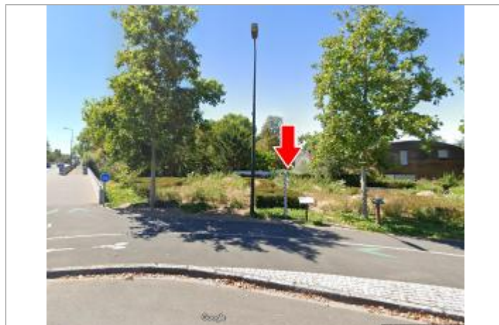
Vue du site en 2020