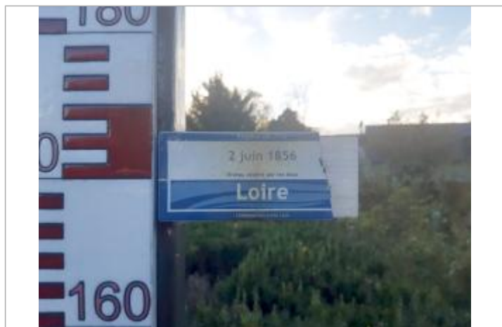
Vue rapprochée du repère, en 2021

Texte : 2 juin 1856 - Niveau atteint par les eaux - Loire Maximum de l'inondation : Oui Visibilité : Oui État du repère : Moyen Pérennité : Longue