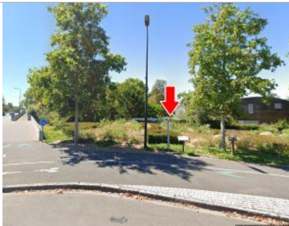
Vue du site en 2020