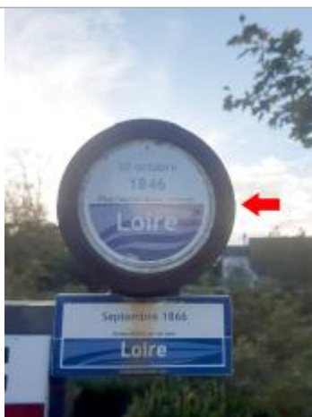
Vue rapprochée du repère, en 2021