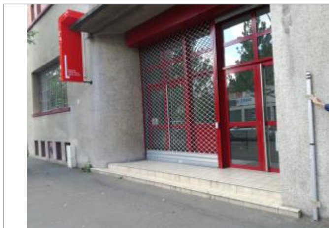
Projet de repère 1910 - Auteur: Artelia