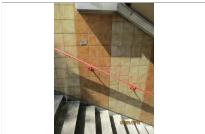
Projet de repère 1910 - Auteur: Artelia

Altitude calculée de l'eau (en m) : 36.26