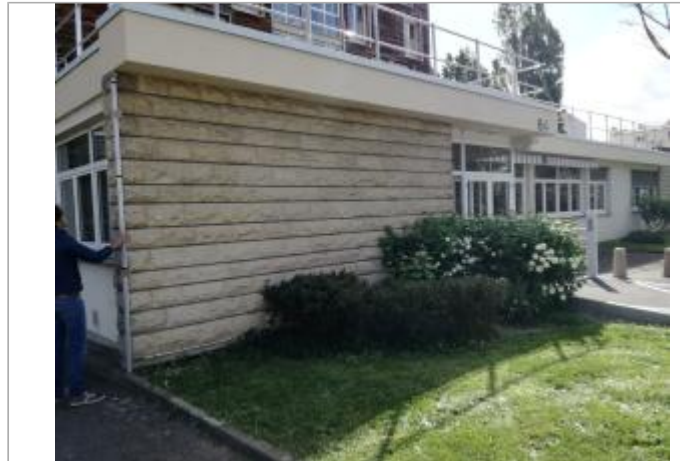
Projet de site - Auteur: Artelia

Coordonnées WGS84 : X: 2.39636470 / Y: 48.79212060