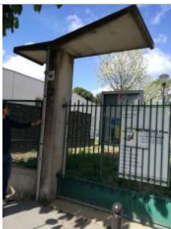
Projet de repère 1924 - Auteur: Artelia