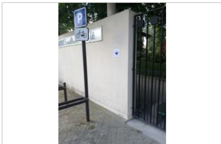
Projet de repère 1910 - Auteur : Artelia