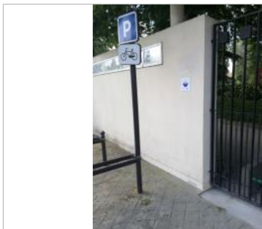
Projet de repère 1910 - Auteur: Artelia