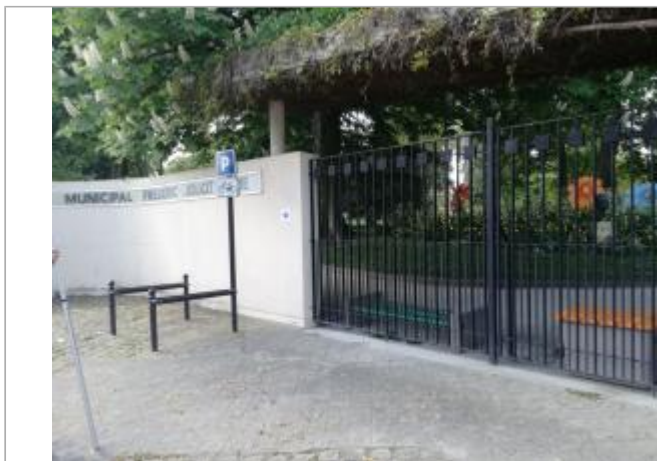
Projet de site - Auteur: Artelia

Coordonnées WGS84 : X: 2.39441600 / Y: 48.78632930