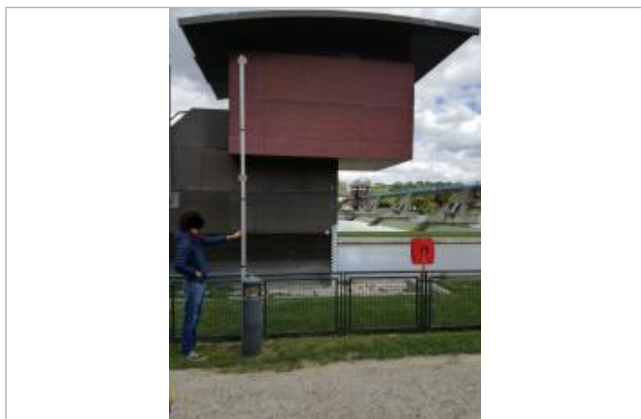
Projet de repère 1982 - Auteur: Artelia