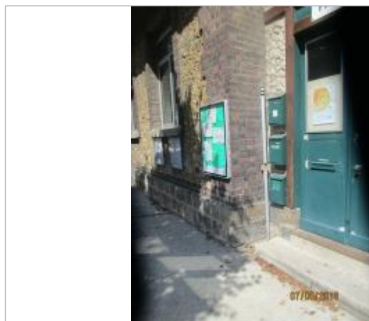
Projet de repère 1910 - Auteur: Artelia