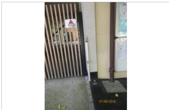
Projet de repère 1910 - Auteur: Artelia