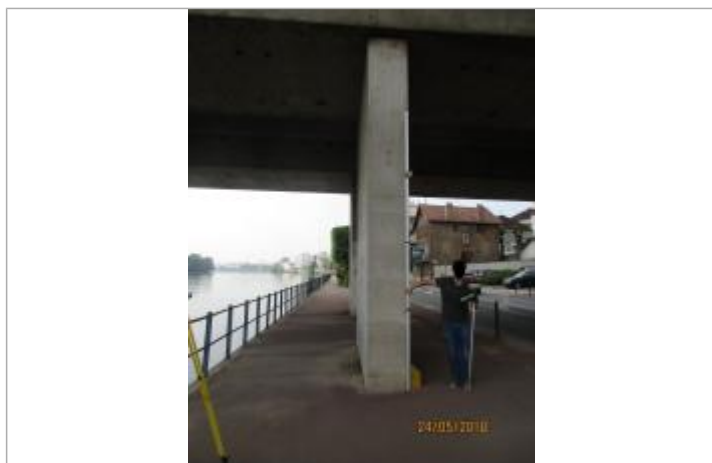
Projet de repère 2016 - Auteur : Artelia