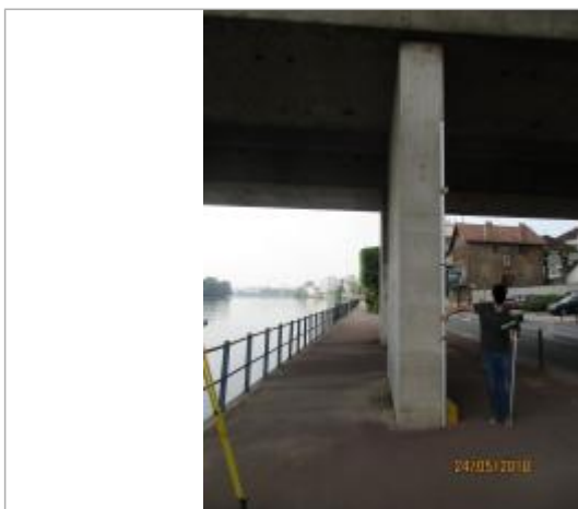
Projet de repère 2016 - Auteur : Artelia