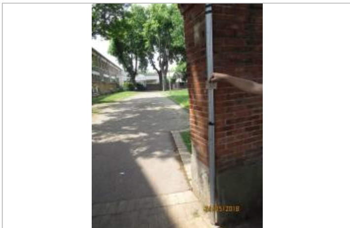
Projet de repère 1910 - Auteur: Artelia

Altitude calculée de l'eau (en m) : 36.25 m