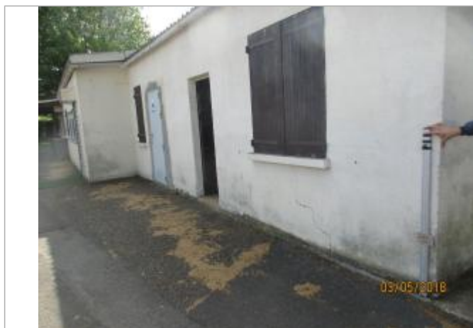
Projet de repère 1910 - Auteur : Artelia