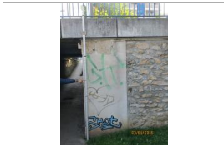
Projet de repère 1910 - Auteur: Artelia