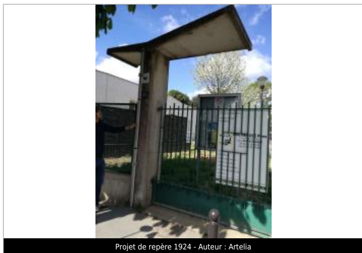
Projet de repère 1924 - Auteur : Artelia