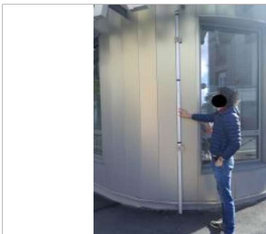
Projet de repère 1910 - Auteur : Artelia