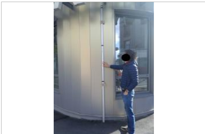
Projet de repère 1924 - Auteur: Artelia

Altitude calculée de l'eau (en m) : 33.72